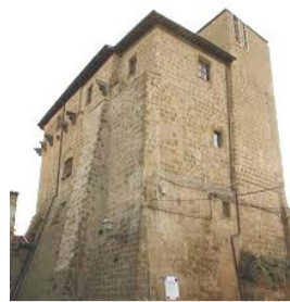
La Rocca Farnese

Oggi la Rocca è ancor per il paese un motivo d'orgoglio di un passato che sempre con amor va ricordato e ch'è vanto di ogni cellerese.