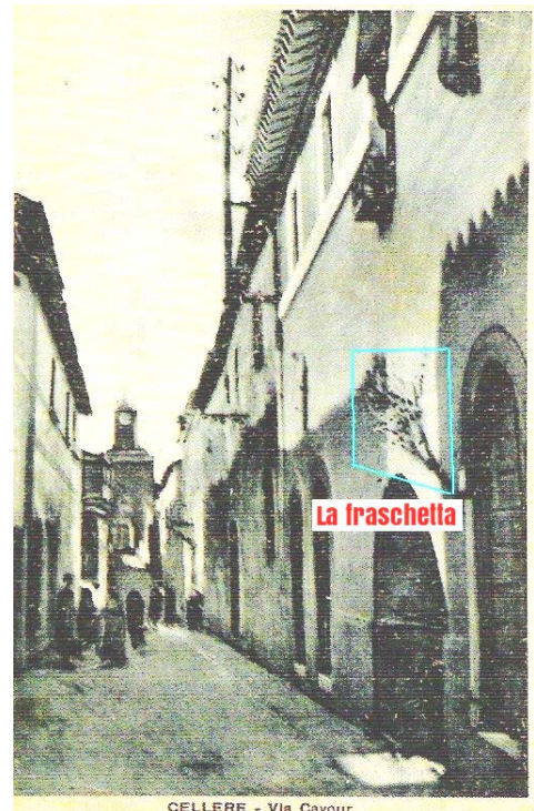
CELLERE - Via Cavour

Quest'oggi ho fatto un tuffo nel passato ed un mondo diverso ho ricordato, infatti son tornate alla mia mente voci particolari della gente che animavan la vita di un paese senza alcun lusso e con poche pretese. Ho risentito: "Cicorietta donneee!", e rivisto a comprarla mamme e nonne; ho rivissuto il grido del passato, che diceva: "Chi vo' 'l latte cajatooo?". A maggio ben si udiva dalle case la donna che vendeva le cerase, poi: "Lumacciole donneee!" ho risentito e pure le parole del quesito: "Le volete 'na tazza oppure due?". "'na tazza ché le magna solo lue", e per "lue" intendeva suo marito, cui piaceva quel piatto saporito. Adesso a un altro grido presto arrivo, che dichiarava: "Pesce vivo vivooo!"; era venduto dalla "Paradisa", e talor s'innalzavano le risa perché qualcuno diceva in dialetto: "Sta' attente ché te fugge dal carretto!", infatti con tal mezzo lo portava e per le vie di Cellere girava. Ho pure riascoltato "Policano", che dava un *"banno" utile ma strano: dopo aver preso un foglio dalla giacca, diceva a voce alta che una vacca