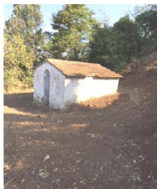
Madonna del Brucio

Disteso su un prato di sogni ad occhi aperti, osservo il grigio cielo e il lento cammino di nubi da mille sembianze. D'improvviso, un ampio volo d'uccelli invade il magico schermo e pur la mia mente, e a quel volo sicuro affido, quale novello àugure, le mie incertezze, i miei dubbi e cerco e invoco risposte. Ma chi mi sospinge a sì arcani pensieri? Di certo l'Etrusco che alberga in me da tempi remoti, da tempi sapienti, misteriosi di orgogliosi, imperituri avi .